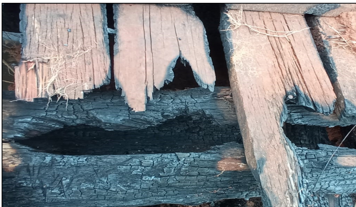
Imagem 4: Estado Atual, do autor, em 19 de Setembro de 2024.