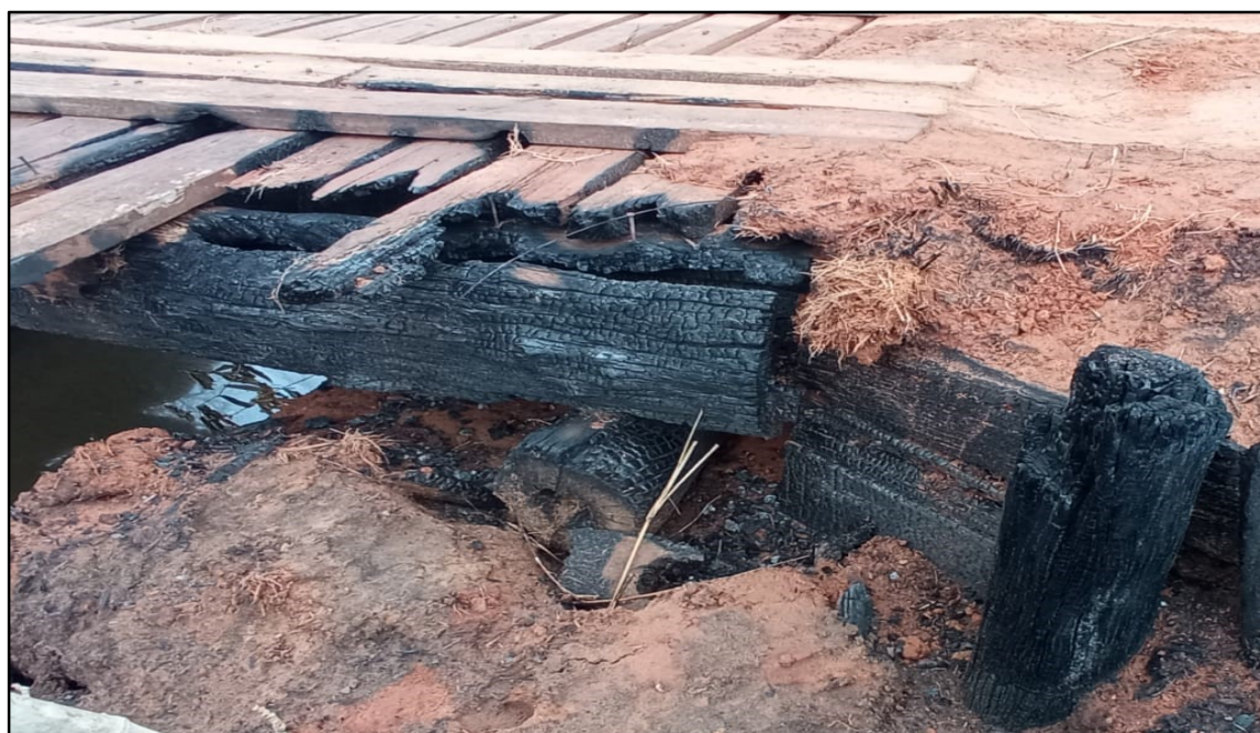
Imagem 5: Estado Atual, do autor, em 19 de Setembro de 2024.