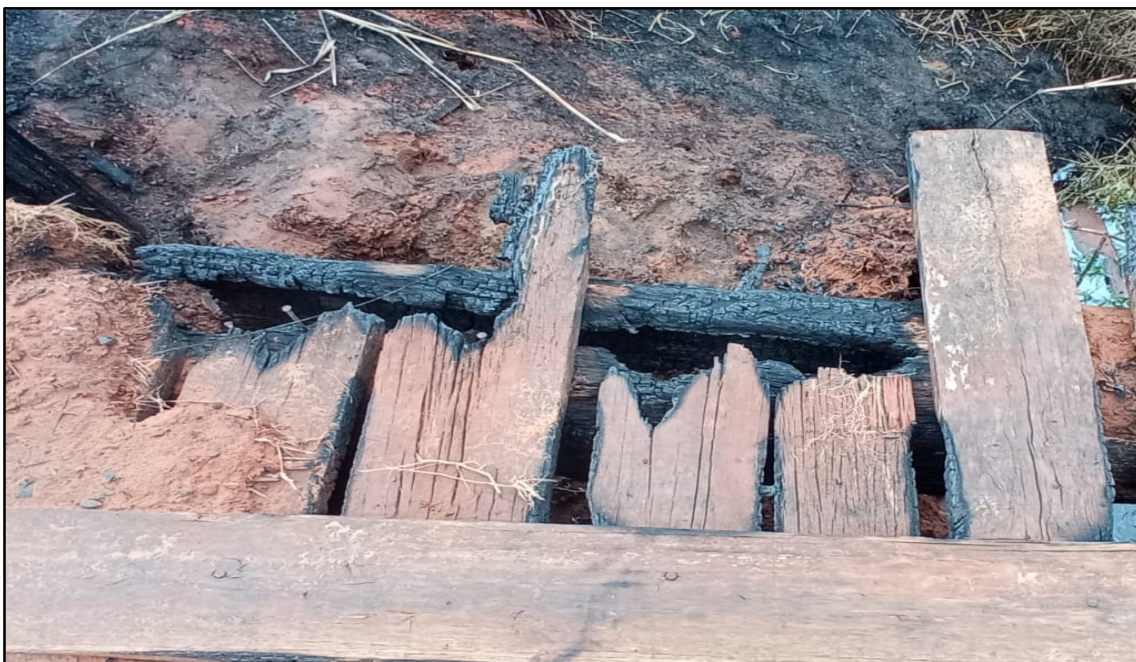
Imagem 7: Estado Atual, do autor, em 19 de Setembro de 2024.