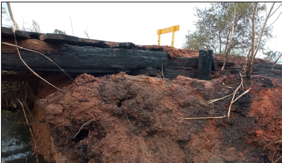
Imagem 1: Estado Atual, do autor, em 19 de Setembro de 2024.