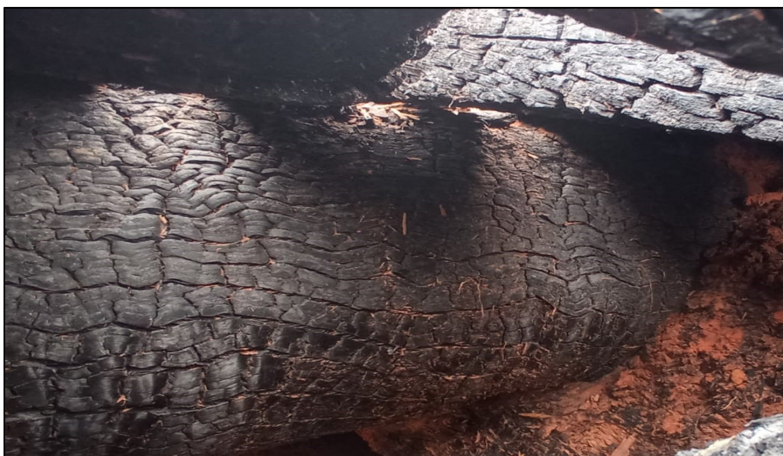
Imagem 2: Estado Atual, do autor, em 19 de Setembro de 2024.