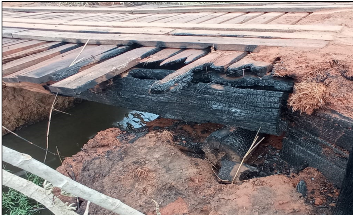
Imagem 8: Estado Atual, em 19 de Setembro de 2024.

Sem mais para o momento, Atenciosamente.