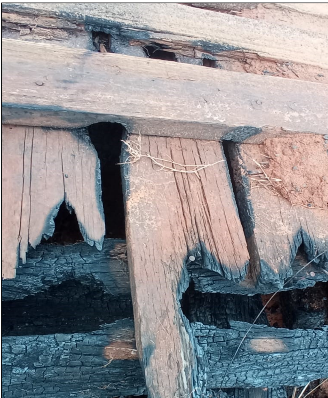
Imagem 3: Estado Atual, do autor, em 19 de Setembro de 2024.