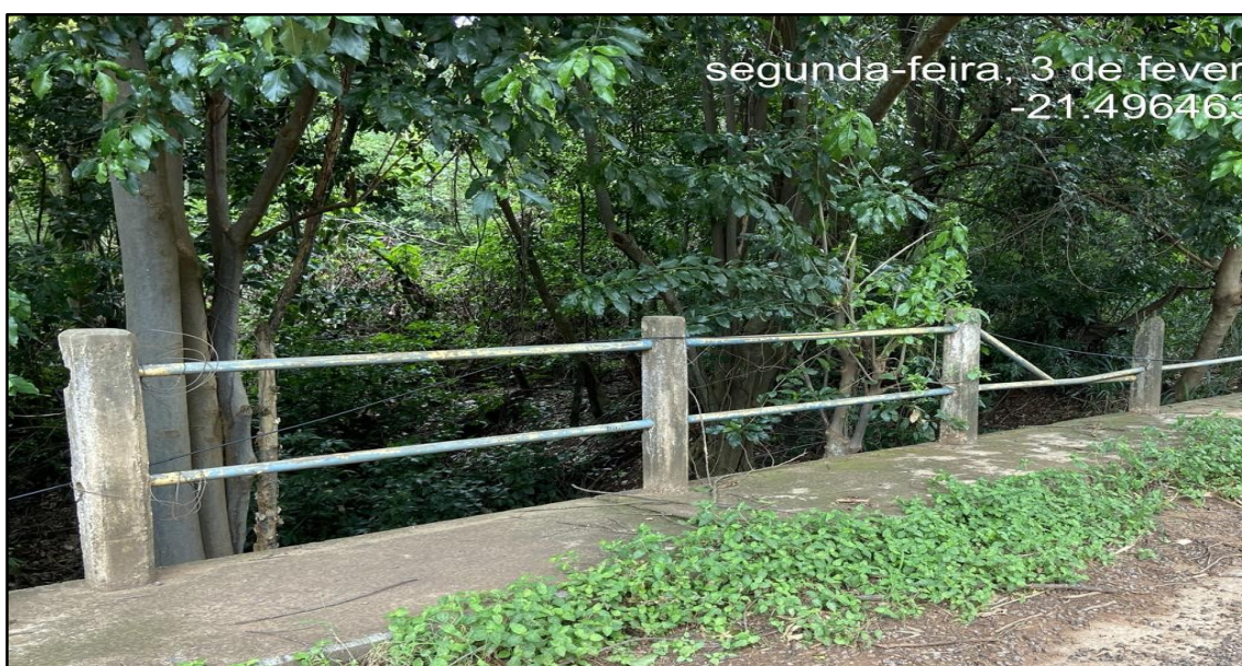
Imagem 4: Estado Atual, em 03 de Fevereiro de 2025.