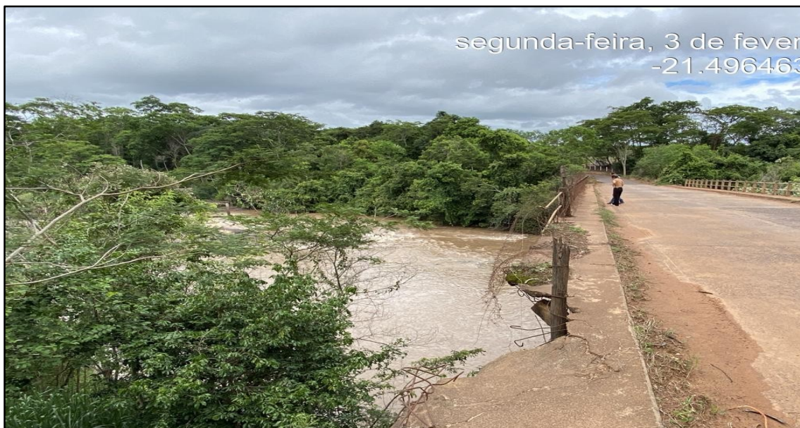
Imagem 5: Estado Atual, do autor, em 03 de Fevereiro de 2025.