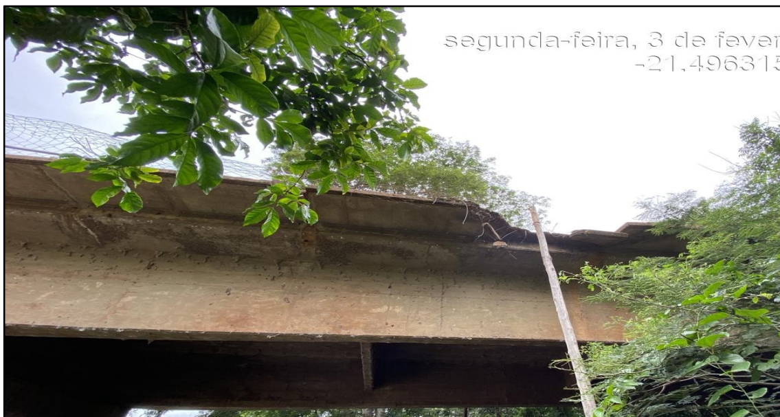
Imagem 6: Estado Atual, do autor, em 03 de Fevereiro de 2025.