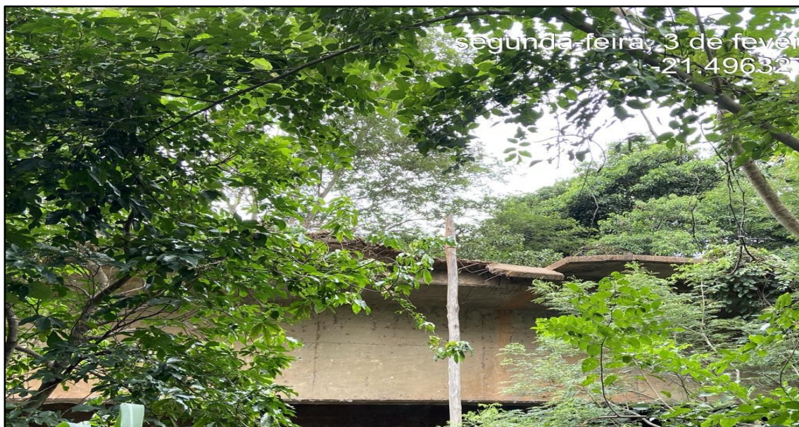
Imagem 3: Estado Atual, do autor, em 03 de Fevereiro de 2025.