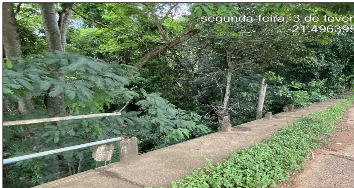
Imagem 8: Estado Atual, do autor, em 03 de Fevereiro de 2025.