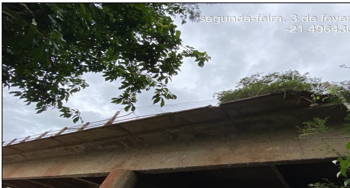
Imagem 9: Estado Atual, do autor, em 03 de Fevereiro de 2025.

Sem mais para o momento, Atenciosamente.