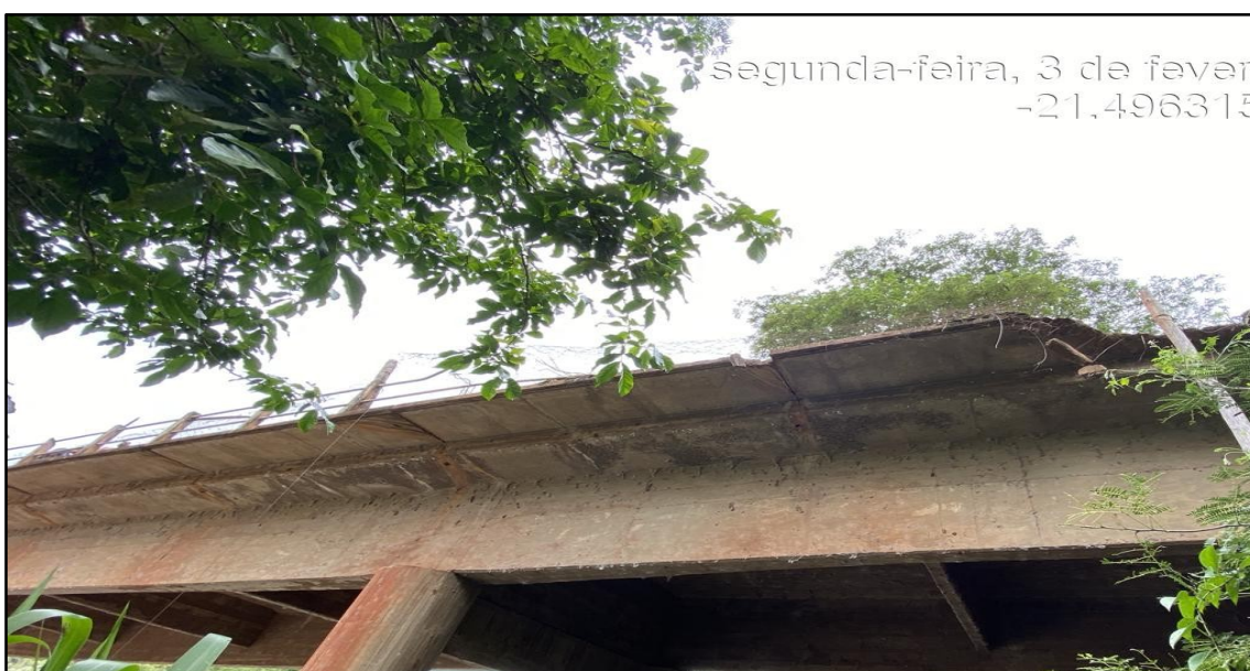
Imagem 2: Estado Atual, do autor, em 03 de Fevereiro de 2025.