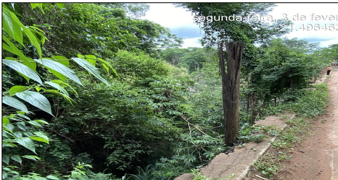
Imagem 1: Estado Atual, do autor, em 03 de Fevereiro de 2025.